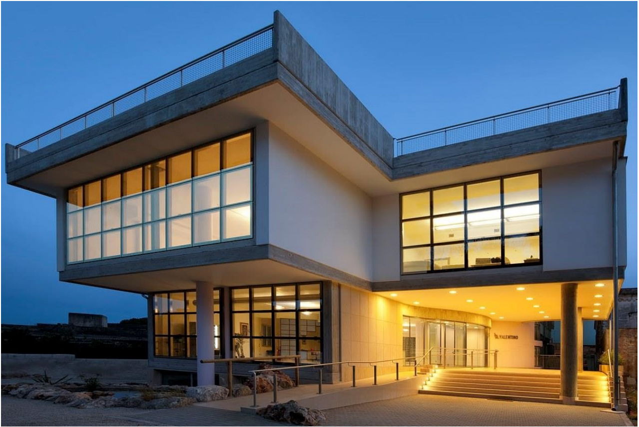
- Centro Clinico Dr. Valentino – Copertino (Lecce) -2005-06 (progettazione strutturale)