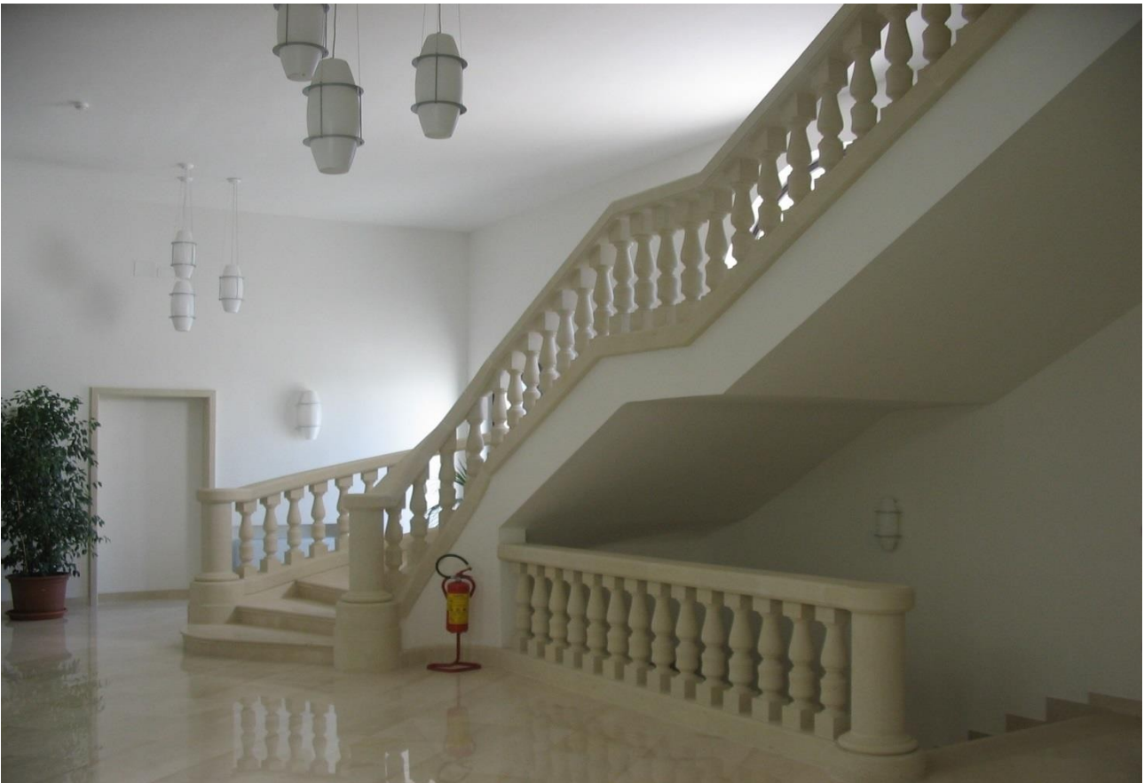
- Ampliamento dello stabilimento metalmeccanico della CTM - Lecce - 2005

(progettazione architettonica e strutturale)